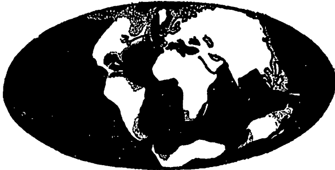
الشكل الثالث : يبين حالة الأرض بعد أن استقر أمرها ، قبل مليون سنة