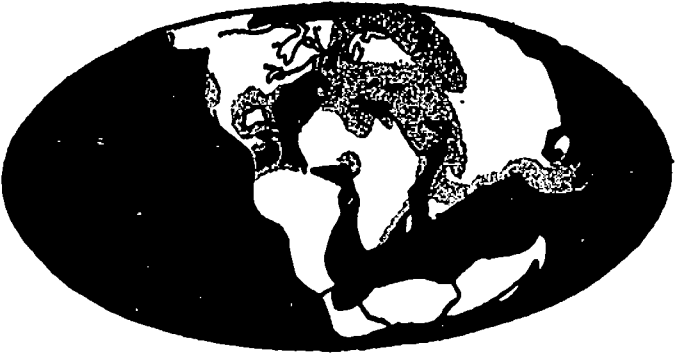
الشكل الثاني : يبين حالة الأرض أثناء عملية انتشار وتباعد قاراتها وقد بدأت هذه العملية قبل خمسين مليون سنة